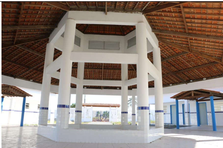
CONSTRUÇÃO DE ESCOLA COM 06 SALAS PADRÃO FNDE NOS POVOADOS PALMEIRA E ALECRIM