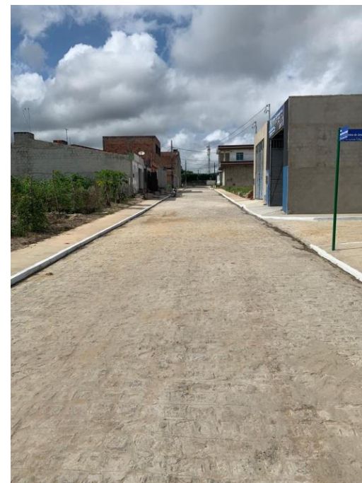
PAVIMENTAÇÃO DE RUAS DO CONJUNTO KEKA