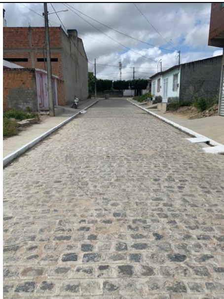
PAVIMENTAÇÃO DE RUAS DO CONJUNTO KEKA