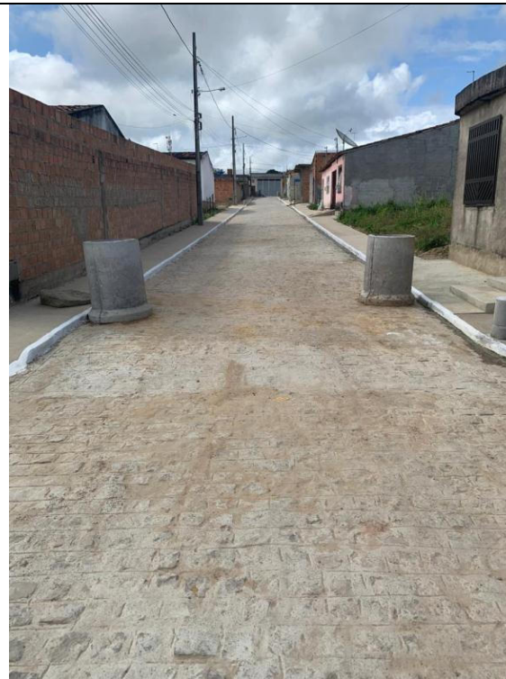
PAVIMENTAÇÃO DE RUAS DO CONJUNTO KEKA