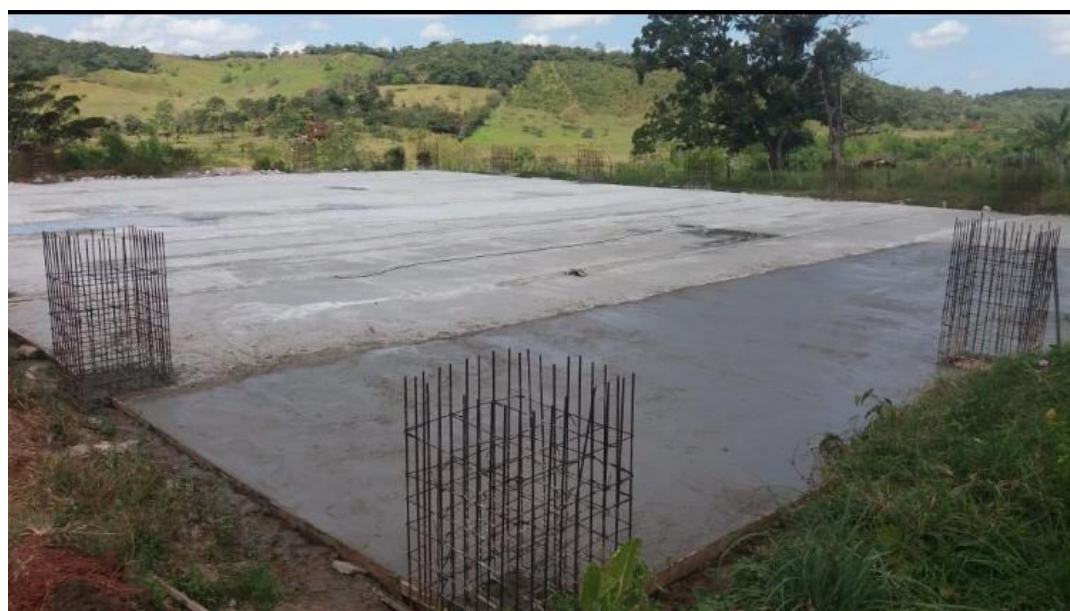
CONSTRUÇÃO DE QUADRA NO POVOADO TABUA