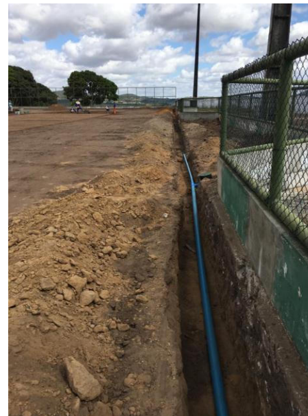
REFORMA DO ESTÁDIO FLORO ALVES DE ARAUJO