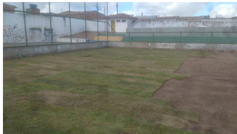
REFORMA DO ESTÁDIO FLORO ALVES DE ARAUJO