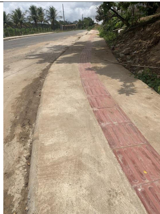
URBANIZAÇÃO DA ENTRADA DA CIDADE E PAVIMENTAÇÃO DA RUA JOSÉ RAMOS DE SOUZA