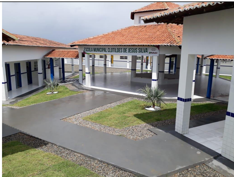
CONSTRUÇÃO DE ESCOLA COM 06 SALAS PADRÃO FNDE NOS POVOADOS PALMEIRA E ALECRIM