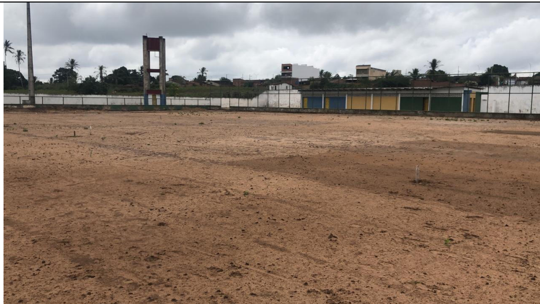
REFORMA DO ESTÁDIO FLORO ALVES DE ARAUJO