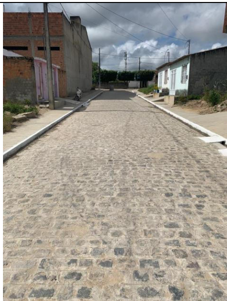
PAVIMENTAÇÃO DE RUAS DO CONJUNTO KEKA