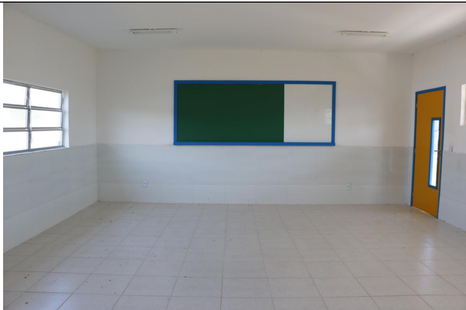
CONSTRUÇÃO DE ESCOLA COM 06 SALAS PADRÃO FNDE NOS POVOADOS PALMEIRA E ALECRIM