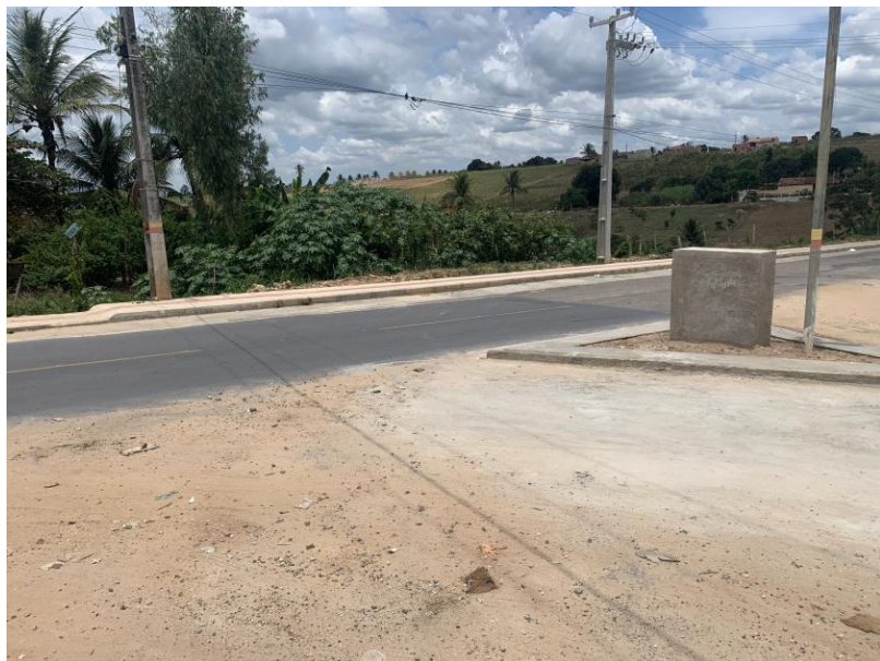
URBANIZAÇÃO DA ENTRADA DA CIDADE E PAVIMENTAÇÃO DA RUA JOSÉ RAMOS DE SOUZA