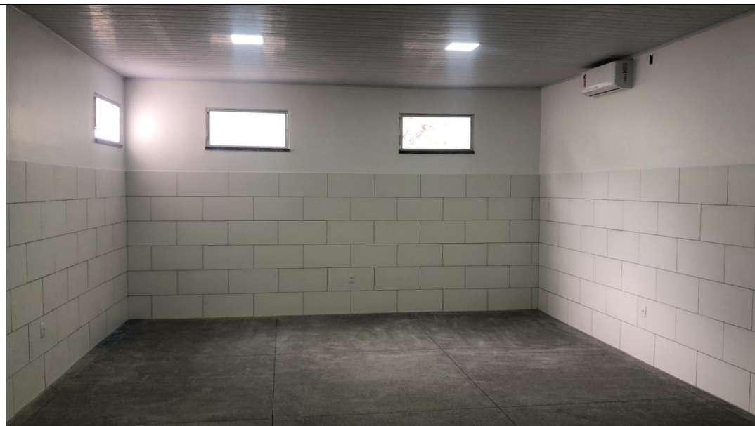
CONSTRUÇÃO DO CENTRO DE FISIOTERAPIA