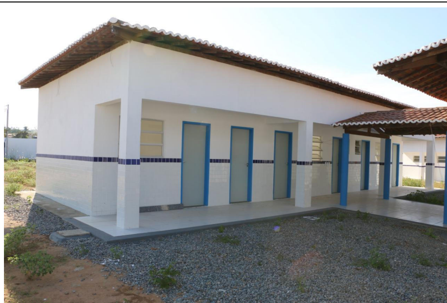
CONSTRUÇÃO DE ESCOLA COM 06 SALAS PADRÃO FNDE NOS POVOADOS PALMEIRA E ALECRIM