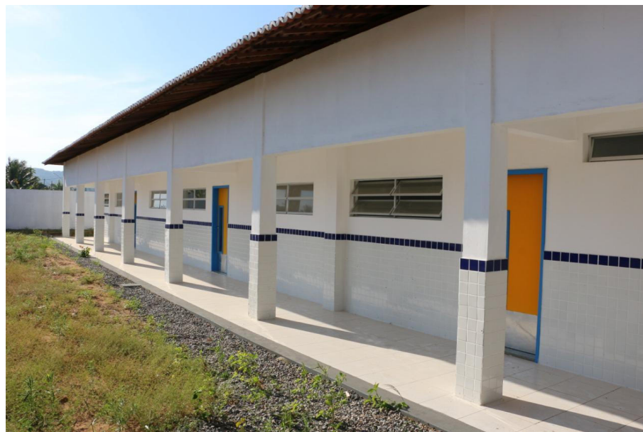
CONSTRUÇÃO DE ESCOLA COM 06 SALAS PADRÃO FNDE NOS POVOADOS PALMEIRA E ALECRIM