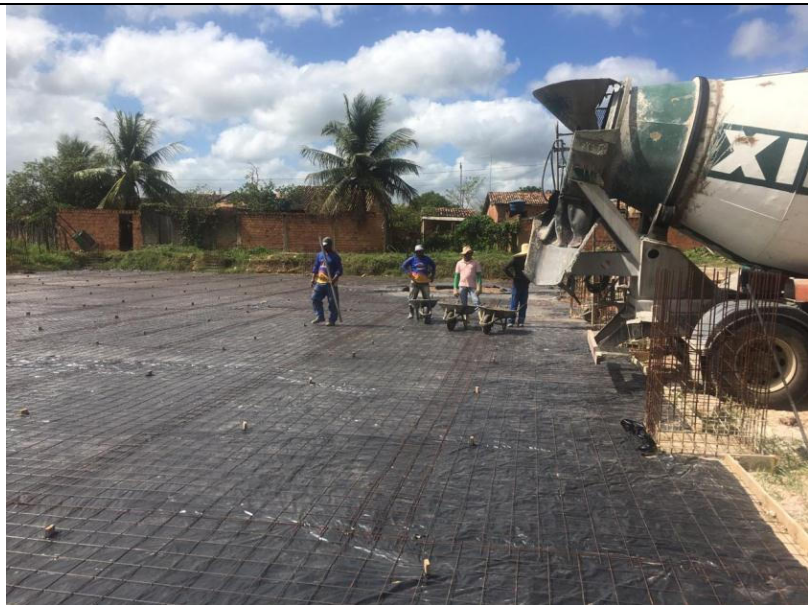
CONSTRUÇÃO DE QUADRA NO POVOADO TABUA