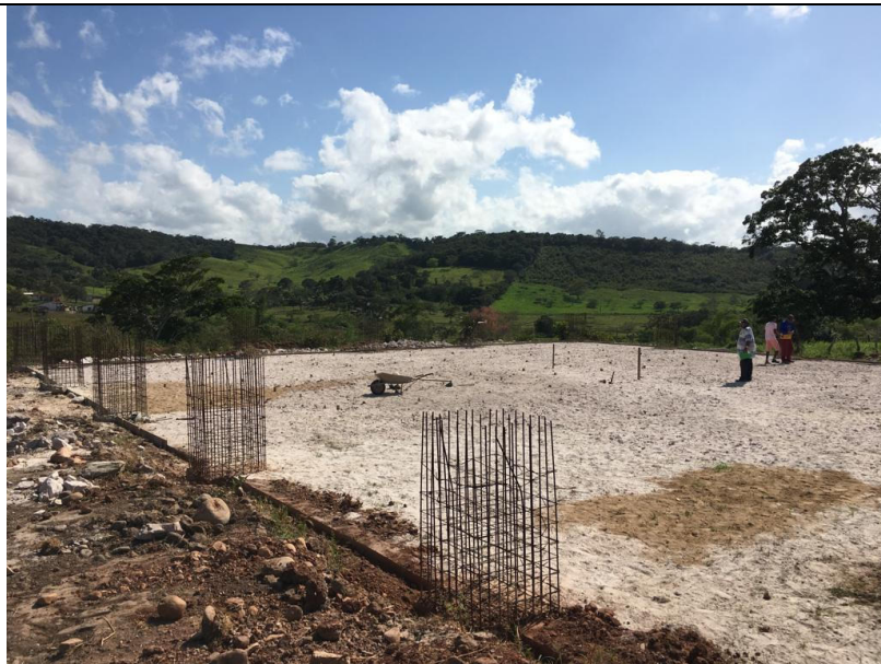
CONSTRUÇÃO DE QUADRA NO POVOADO TABUA