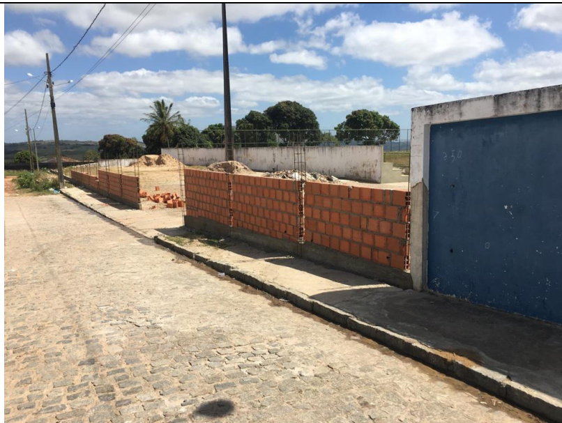
REFORMA DO ESTÁDIO FLORO ALVES DE ARAUJO