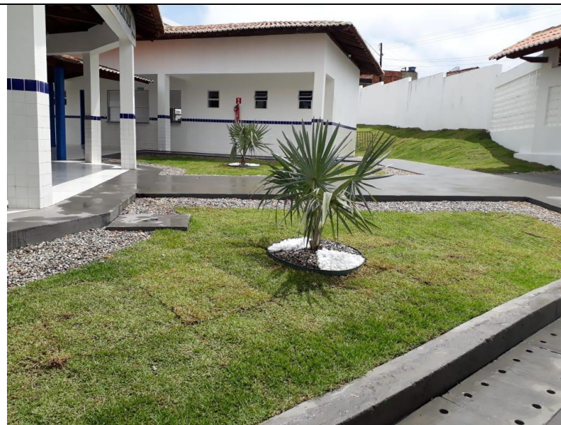
CONSTRUÇÃO DE ESCOLA COM 06 SALAS PADRÃO FNDE NOS POVOADOS PALMEIRA E ALECRIM