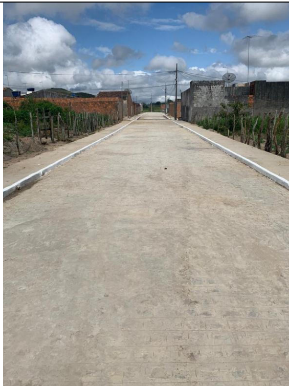
PAVIMENTAÇÃO DE RUAS DO CONJUNTO KEKA