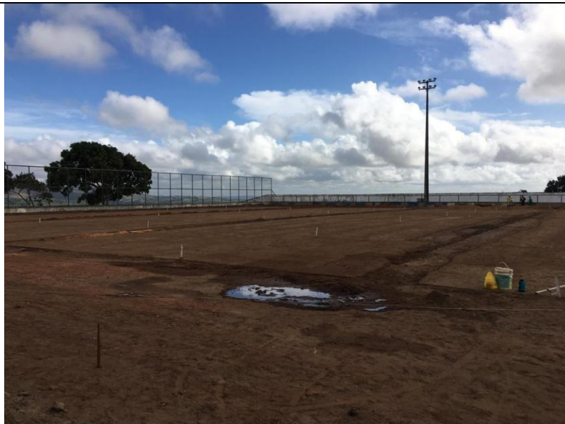
REFORMA DO ESTÁDIO FLORO ALVES DE ARAUJO