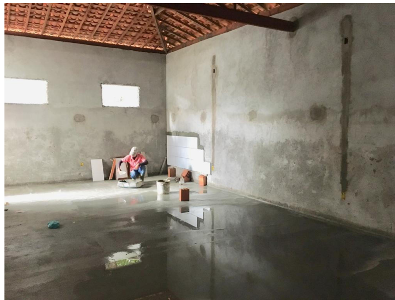
CONSTRUÇÃO DO CENTRO DE FISIOTERAPIA