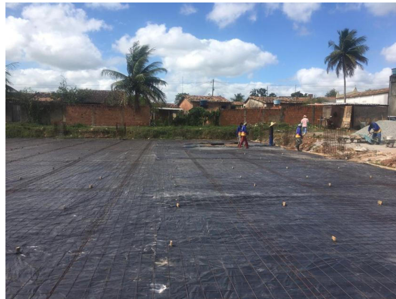
CONSTRUÇÃO DE QUADRA NO POVOADO TABUA