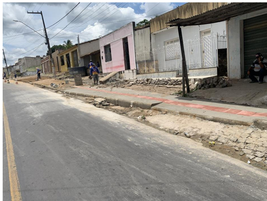
URBANIZAÇÃO DA ENTRADA DA CIDADE E PAVIMENTAÇÃO DA RUA JOSÉ RAMOS DE SOUZA