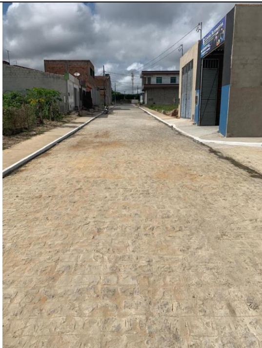
PAVIMENTAÇÃO DE RUAS DO CONJUNTO KEKA