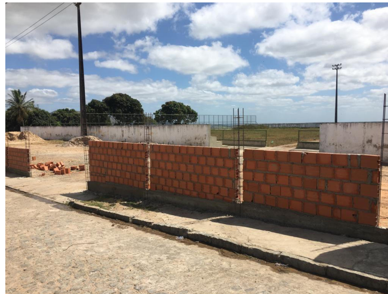
REFORMA DO ESTÁDIO FLORO ALVES DE ARAUJO