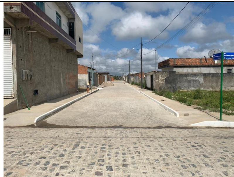
PAVIMENTAÇÃO DE RUAS DO CONJUNTO KEKA