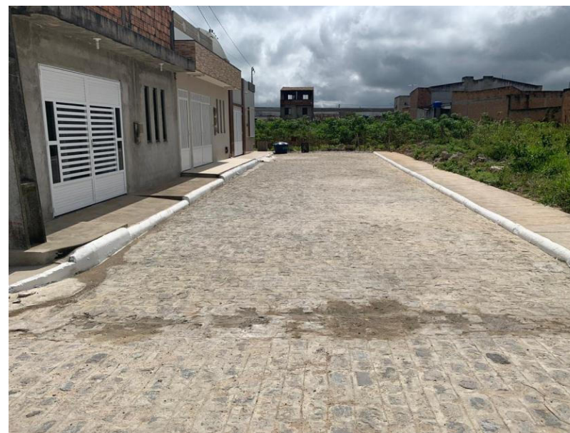
PAVIMENTAÇÃO DE RUAS DO CONJUNTO KEKA