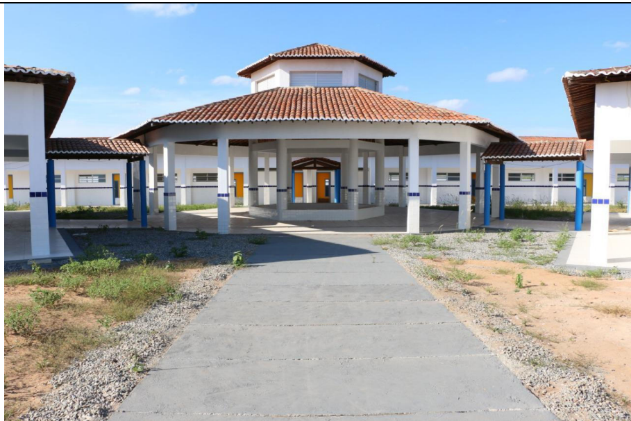
CONSTRUÇÃO DE ESCOLA COM 06 SALAS PADRÃO FNDE NOS POVOADOS PALMEIRA E ALECRIM