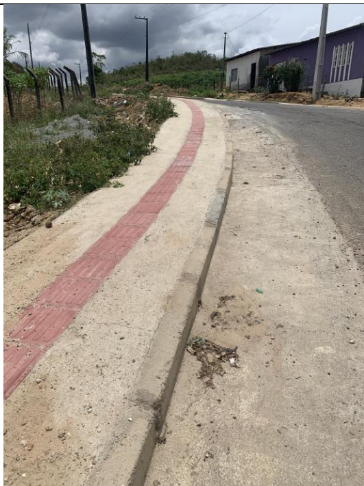
URBANIZAÇÃO DA ENTRADA DA CIDADE E PAVIMENTAÇÃO DA RUA JOSÉ RAMOS DE SOUZA