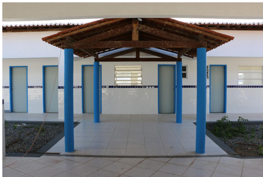
CONSTRUÇÃO DE ESCOLA COM 06 SALAS PADRÃO FNDE NOS POVOADOS PALMEIRA E ALECRIM