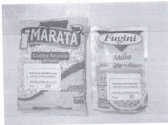
Imagem 7 – Amostras apresentadas da Empresa Gonzaga Distribuidora de Alimentos Eireli, Malhador/SE, 2023.