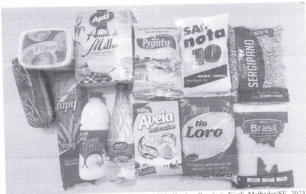
Imagem 3 – Amostras apresentadas da Empresa LH Indústria e Comércio Eireli, Malhador/SE, 2023.