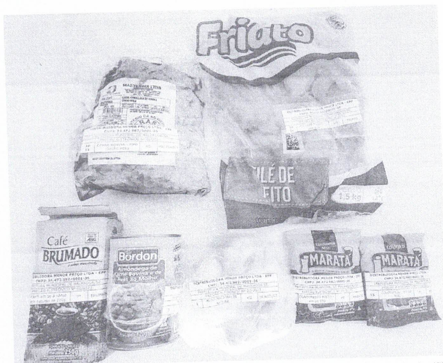
Imagem 2 – Amostras apresentadas da Empresa Distribuidora Menor Preço Ltda, Malhador/SE, 2023.