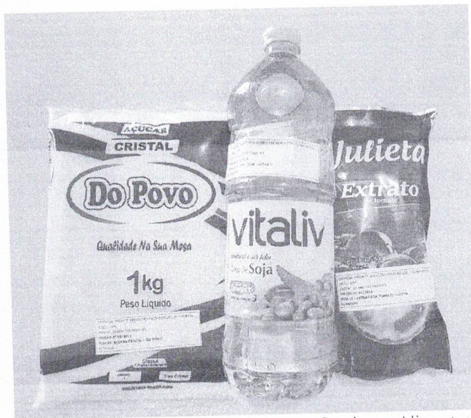
Imagem 1 – Amostras apresentadas da Empresa Projeet Soluções em Serviços e Alimentos Eireli, Malhador/SE, 2023.